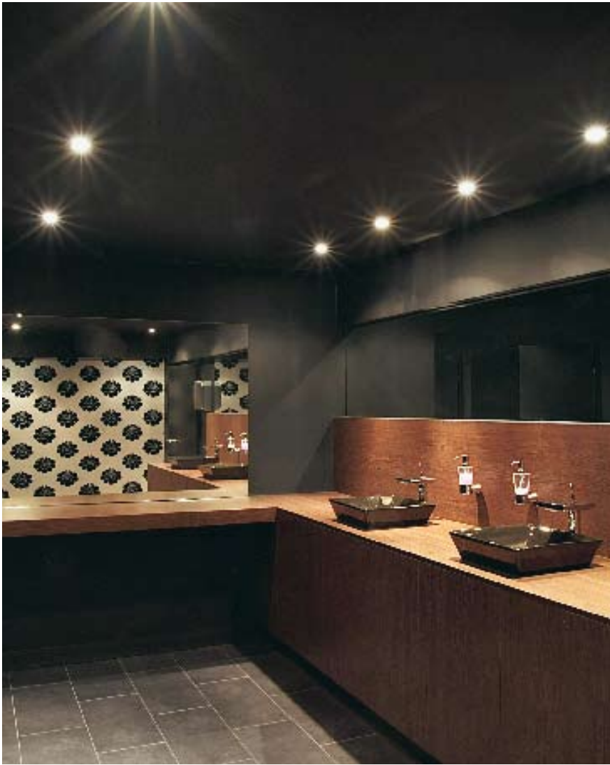
Ook in de toiletten hangt een sexy sfeer.